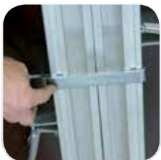
Mordaza de unión ajustable por sistema de rosca