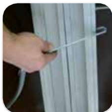
Uniones entre módulos a través de mordazas