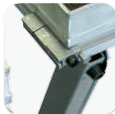
Pieza de nivelado opcional