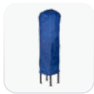
Bolsa de almacenaje (opcional)