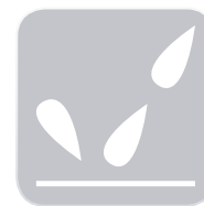
Cubierta impermeable: Acabado película PVC