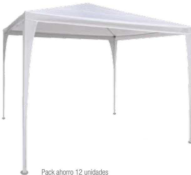
Pack ahorro 12 unidades