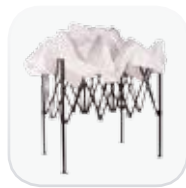
Estructura resistente, reforzada y ligera