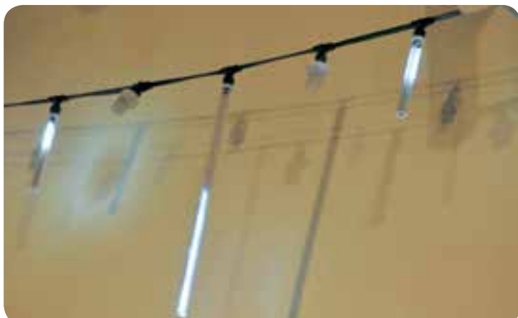
Detalle de guirnalda tipo cinturón con casquillos E27, sobre los cuales se han montado goteos de luz y luces flash estroboscópicas.