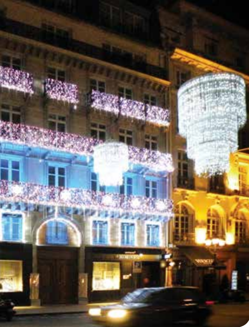
Lámparas realizadas con aros flexy de tres diámetros: 1,9m, 1,27m y 0,63m.