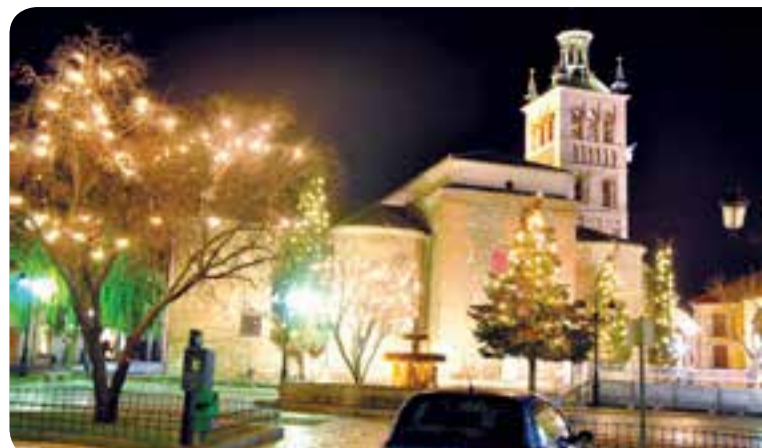
Vista general de un montaje de guirnalda tipo cinturón, montadas directamente sobre copas de árboles en la plaza mayor.