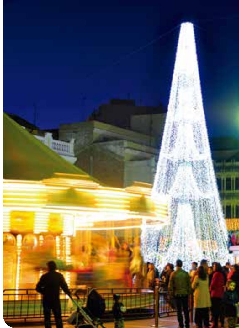
Árbol piramidal realizado con guirnaldas en superficie y cortinas de 3, 6 y 9 metros de longitud.