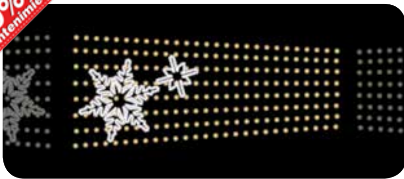
Composición de 2 copos de nieve sobre un manto de guirnalda Led cálida.