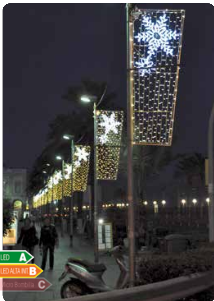
Montaje vertical en farola de secuencia de la figura "Teide".